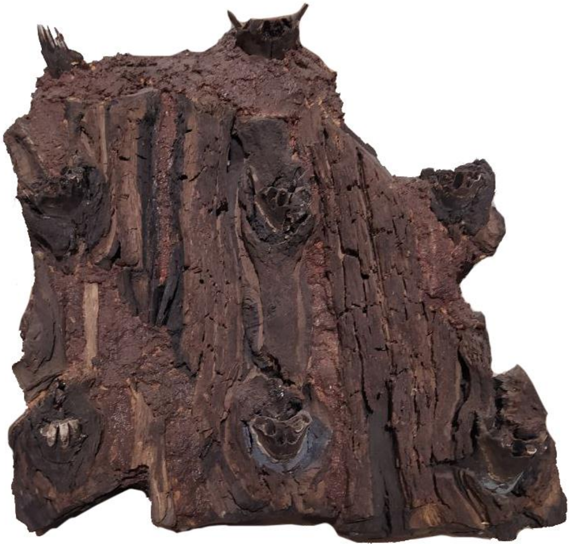
Рис. 1. Дуб Перуна VIII ст. н.е. Колекція МІК