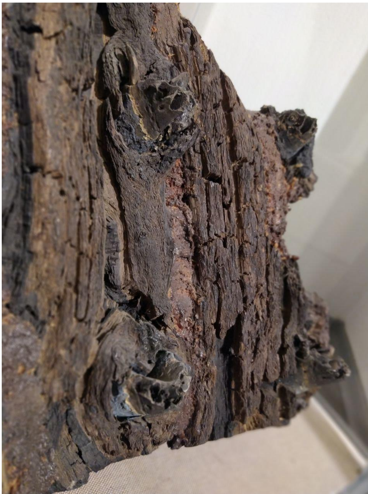
Рис. 2. Дуб Перуна VIII ст. н.е. МК. Ракурс – щелепи збоку.